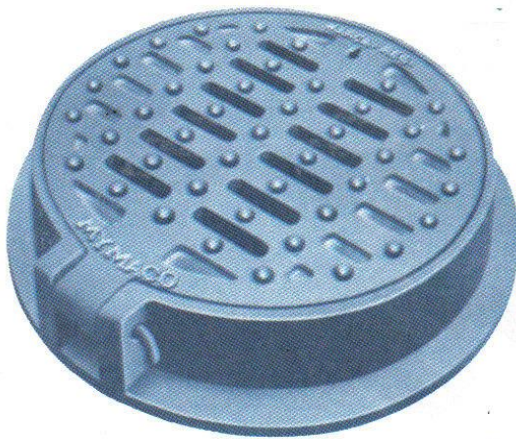
ABIERTO O CON REJILLA